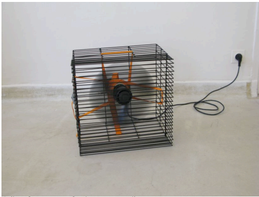
Julien Carretero : Ceci est un ventilateur