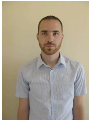
Julien Carretero