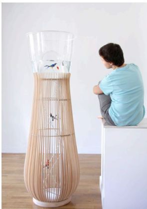
Constance Guisset : Duplex