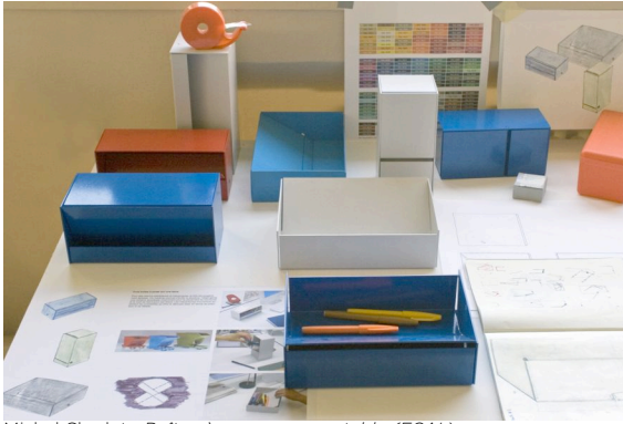
Michel Charlot : Boîtes à poser sur une table (ECAL)